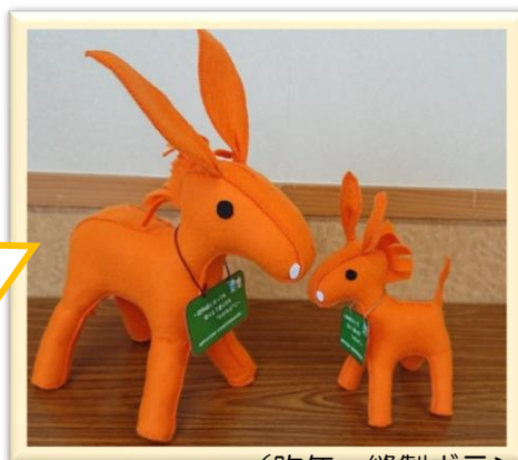
(昨年、縫製ボランティアの方が作製したロバ隊長)